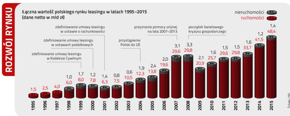
Wykres 1: Rozwój polskiego rynku leasingu w latach 1995-2015 (ZPL).